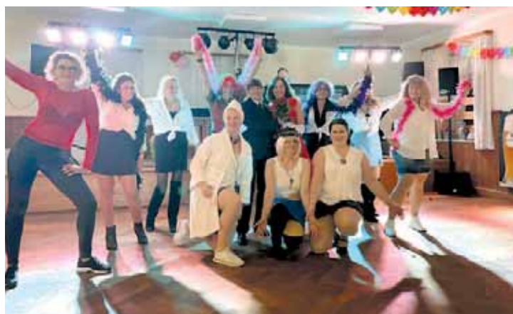
Die Fotos zeigen die Pretty Woman Gruppe sowie Mary Poppins mit Schornsteinfeger Bert, die für ihre Maskierung prämiert wurden.

lautstark geforderten Zugabe durften sie am Ende die Bühne verlassen. Den Ausschank übernahm an diesem Faschingsabend das Team der Vorstandschaft des Frauenkreises. Erstmals gab es auch eine Bar, die gut ankam. Wer Hunger verspürte, konnte über die unterm Saal gelegene Pizzeria eine Pizza ordern.