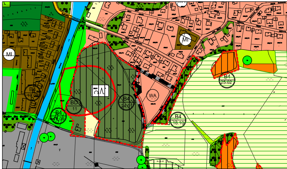
Änderungsbereich 1: Wajon